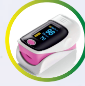
অক্সিজেনৰ স্তৰ পৰীক্ষা কৰক