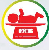
ওজন পৰীক্ষা কৰক