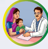
উশাহৰ সংখ্যা গণনা কৰক