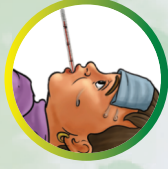
জ্বৰ পৰীক্ষা কৰক