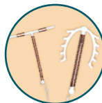
আইইউচিডি, পিপিআইইউচিডি, পিএআইইউচিডি