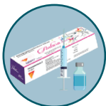
গৰ্ভনিৰোধক বেজী (অন্তৰা)