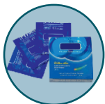
নিৰোধ বা কণ্ডম